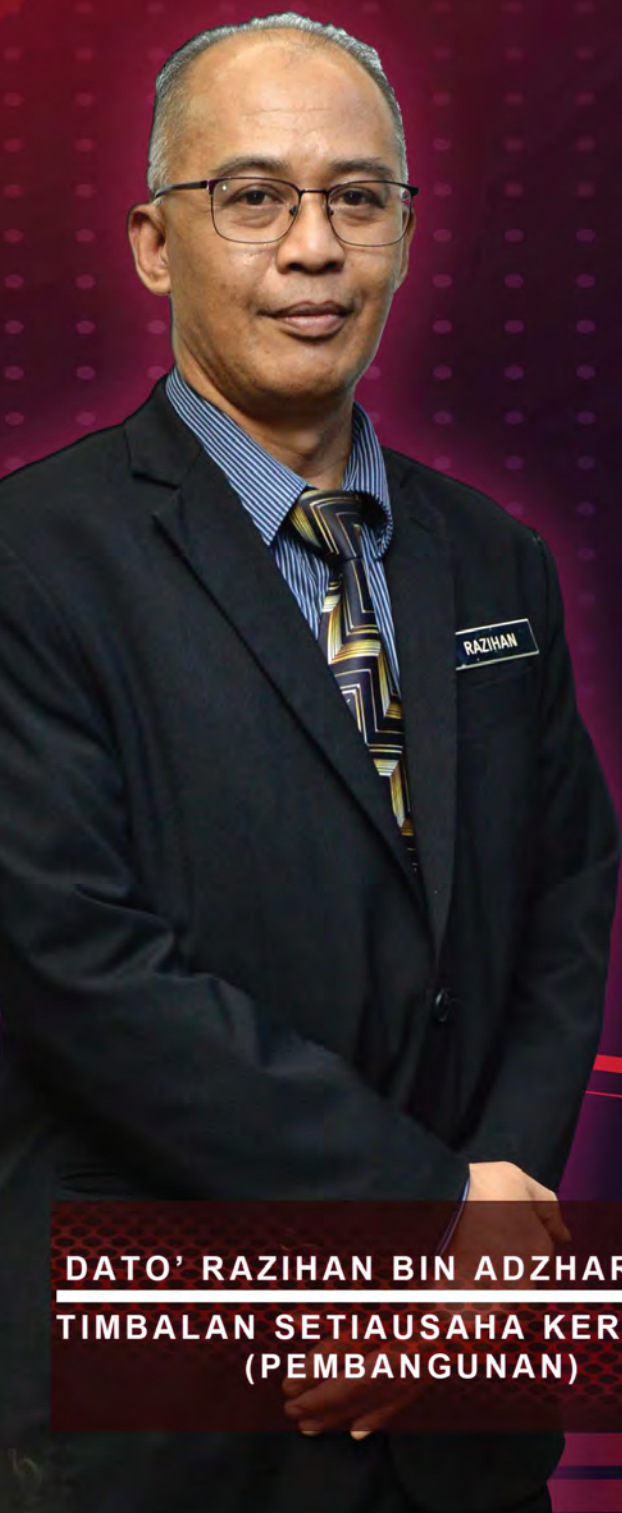
DATO' RAZIHAN BIN ADZHARUDDIN TIMBALAN SETIAUSAHA KERAJAAN (PEMBANGUNAN)